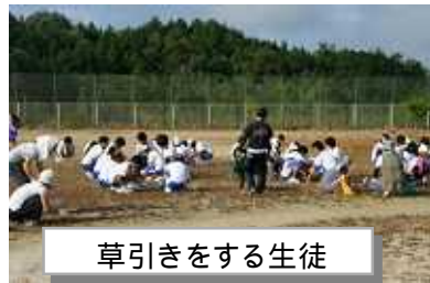
草引きをする生徒

山岡中学校周辺整備を行いました。保護者の方には、主に草刈りを生徒はグラウンドの草引きを行いました。お陰様で気持ちよく2学期を迎える準備ができました。ありがとうございました。